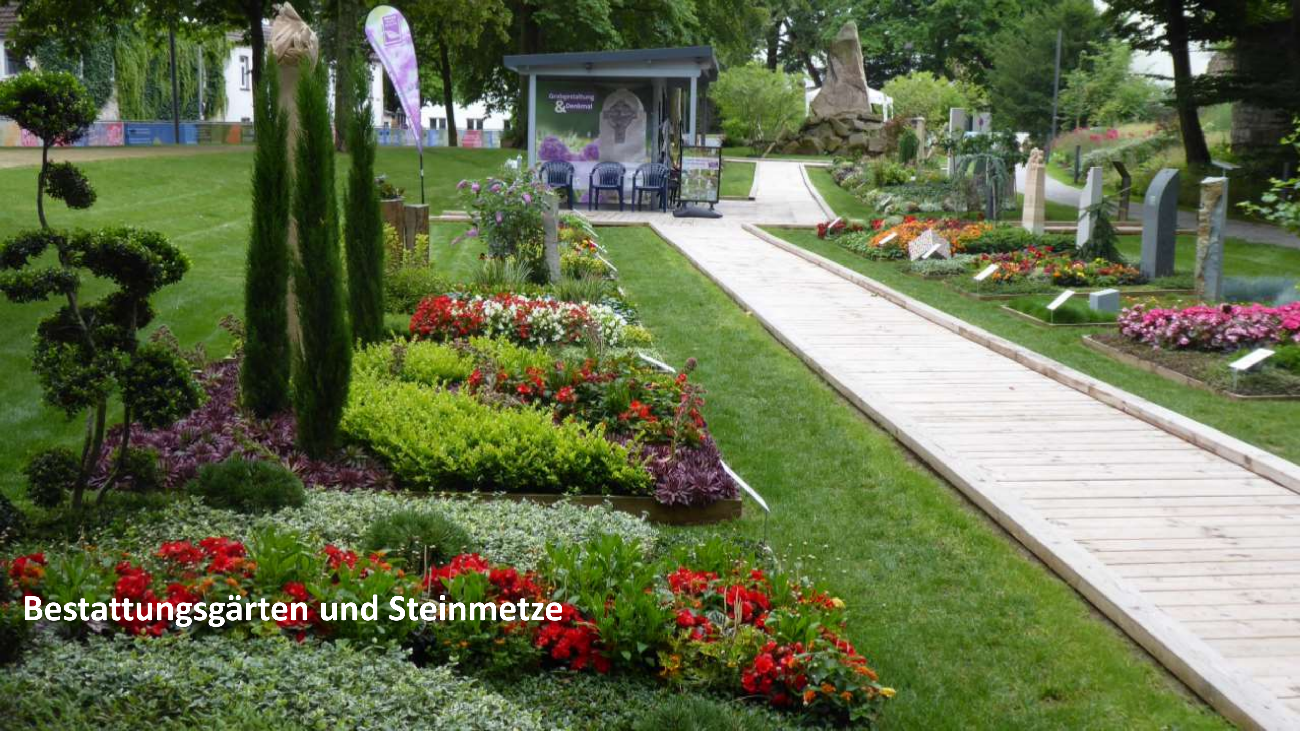
Bestattungsgärten und Steinmetze